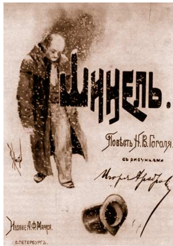
Slika 1: Naslovnica Igorja Grabarja 1890