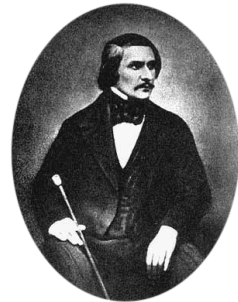
Slika 2: Portret