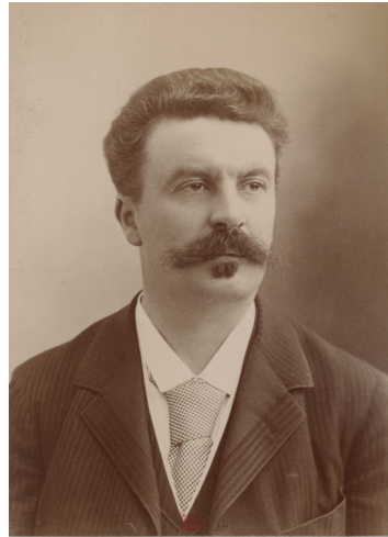
Slika 4: Portret